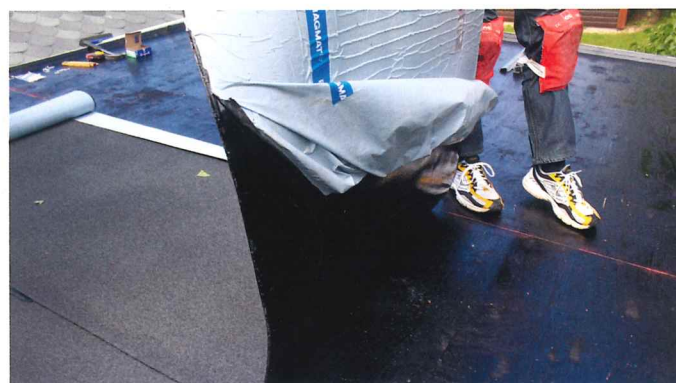
Den del hvor beskyttelsesfilmen er afrevet, kan nu forsigtigt monteres (god ide at være 2 til dette, da rullen ikke kan flyttes når først den er monteret).