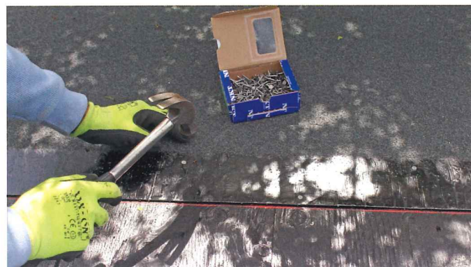
Banerne er på langs af rullen forsynet med en klæbekant, hvor i der sømmes med galvaniseret papsøm med 20 cm mellemrum.