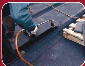
TAG OG TILBEHØR