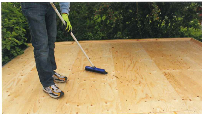
Taget efterses og rengøres.

Izoself Reflex P4 er en et lags selvklæbende tagpap som kun må benyttes til sekundære bygninger som; udhuse, havehuse, legehuse osv. Med et minimumsfald på 2.5 cm./m. Underlaget skal være jævnt, stabilt, tørt, støvfrit og fri for urenheder. Izoself Reflex P4 kan monteres ved temperaturer over +5 C. (ved temperaturer mellem +5 /+15 C er det nødvendigt at opvarme tagpappen med en varmpistol, for at øge vedhæftningen). Pålægningen skal foregå i tørvejr, da fugt og regnvejr vil forringe klæbeevnen.