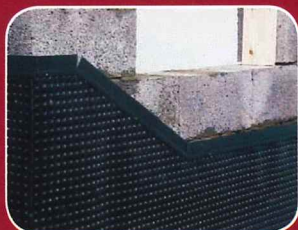
FUGT OG RADONSIKRING