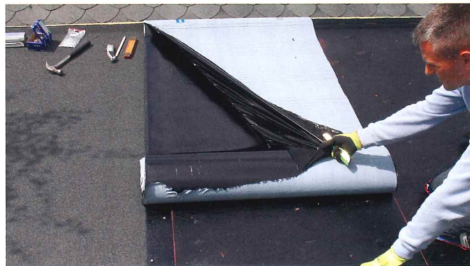
Banerne monteres i tagets falderetning, og ved samlinger må der ikke forekomme modfald. For at holde retning på rullen er det en god ide at bruge en kridtsnor. Rullen rulles ca. halvt ud der hvor man ønsker at montere den, den del som man ønsker at montere først vippes frem (så bagsiden vender op af) beskyttelsesfilmen afrives, vigtigt at den hvide side af beskyttelsesfilmen ikke kommer i berøring med undersiden af tagpappen, den vil i givet fald være meget vanskelig at få af igen.