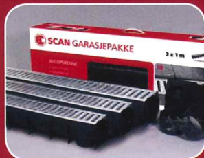
HAVEN / UDEMILJØ