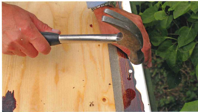
Der monteres fodblik v/tagfoden så vandet kan dryppe af, og der monteres trekantlister langs vindskederne så knæk og skarpe buk på tagpappen undgås.