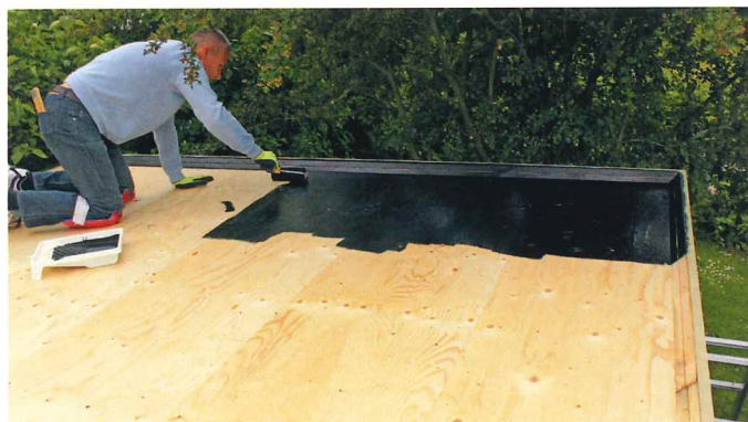
For at forbedre vedhæftningen grundes underlaget med en bitumen primer, tørretiden er afhængig af vejret og vil i de fleste tilfælde være ca. 1 døgn.